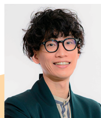
もりやすバンバンビガロ 様