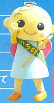
がん啓発キャラクター ふっぴー