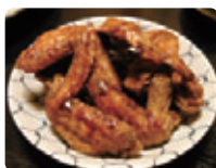
世界の山ちゃん 幻の手羽先