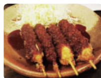
矢場とん みそ串カツ

開催日時：1月28日(土) 17:40～ 開催場所：名古屋国際会議場 3号館 B1F カスケード 参加費は無料です。入場の際は必ずネームカードをご着用ください。 名古屋グルメとワインをご用意してお待ちしております。