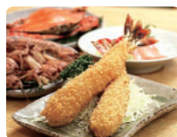
まるは食堂 ジャンボエビフライ