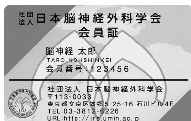
(一社)日本脳神経外科学会 会員証

学会参加期間中は、毎日、来場時（学会場に来た時）および退場時（学会場から帰る時）に領域講習受付を「下記」会員証（ICカード）で行ってください。