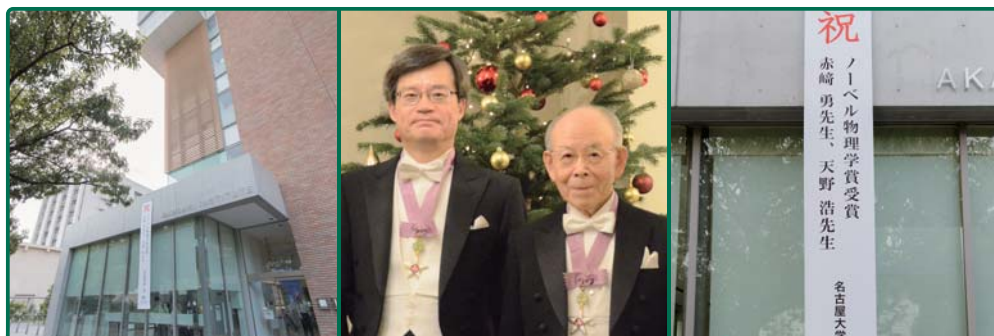
赤崎記念研究館1階