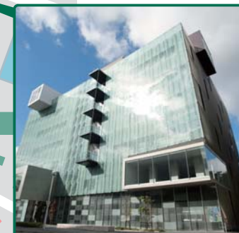
野依記念物質科学研究館2階