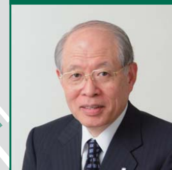
野依 良治 特別教授