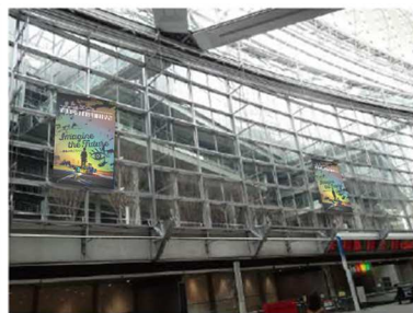
ガラス棟内（ロビーギャラリー）から見たイメージ