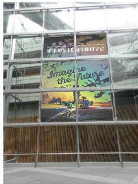
地上広場から見たイメージ