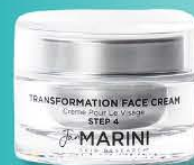
マリーニ フェイスクリーム