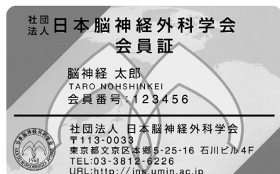
(一社)日本神経外科学会 会員証

学会参加期間中は、毎日、来場時(学会場にきた時)および退場時(学会場から帰る時)に領域講習受付を「下記」会員証(ICカード)で行ってください。