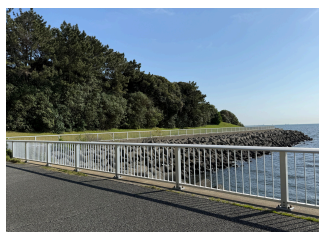
②ウォーキングコースから海に出たところの眺め