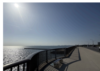
④美浜大橋から富士山方面 富士山、アクアライン、スカイツリーなどが見られるかも?!