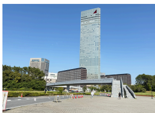
①幕張メッセ周辺歩道橋