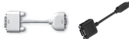
外部出力用変換ケーブル