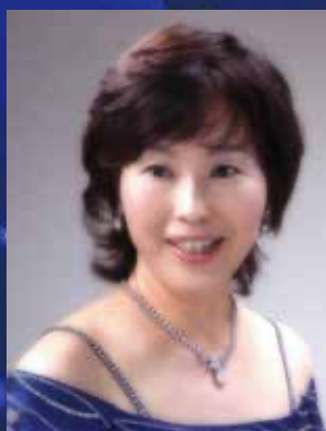
米澤悦子〔ソプラノ〕